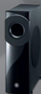
YSP-4300 NEW Black Digital Sound Projector™ Wireless Subwoofer