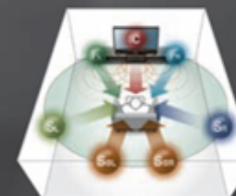
AIR SURROUND XTREME